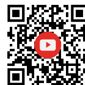
Rollrückwände im Video